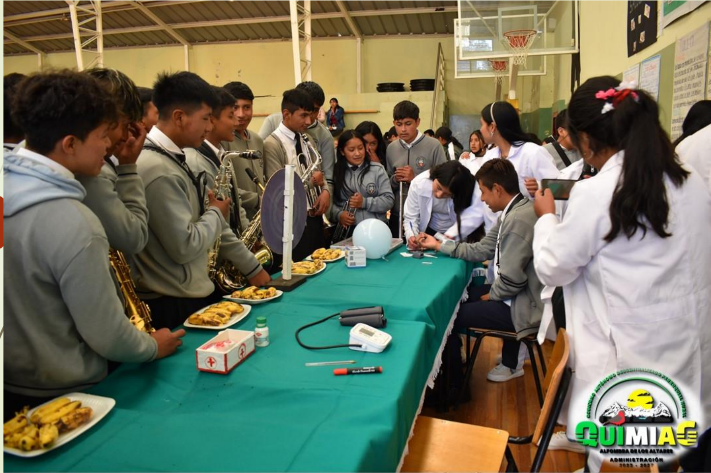
Feria de salud y emprendimientos